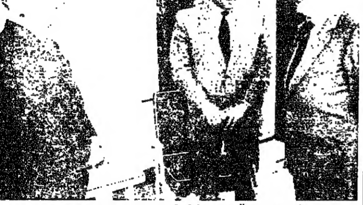
مبارك يتوسط الحسين وعزيز (رويترز)

وقد اجتمع امير الكويت صباح صباح امين اجتماعهم في الاستدراية (رويترز) وقال الرئيس المصري حسني مبارك في اجتماع مع وزير الخارجية العراقي اسد حيدر في بغداد يوم 2٠ تموز ١٩٩٠ في مدينة القاهرة. وكان مسؤولون مصريون قد قالوا في وقت سابق ان مصر والاردن سيبقيان على خلاف في النزاع وان كان احد المسؤولين قد قال ان مصر تتعامل مع الكويت. وفي بغداد قال التلفزيون العراقي ووكالة الانباء العراقية ان السيد عزيز عاد الى العراق دون الايلاء بأي تعقيب على محادثاته. وقال مراقبون سياسيون انه من المتوقع ان يبلغ عزيز الرئيس صدام حسين بتلخيص زيارته في وقت لاحق اس. والى عمان عاد الملك حسين بعد زيارته للعمل القصيرة لخص. وتحدث وكالة الانباء الاردنية ان المعامل الاردني والرئيس مبارك بحثا السبل الميضية بتصعيد الخلافات وتوحيد الصف العربي اضافة الى سبل منفصلة مع كل من الرئيس مبارك والسيد عزيز. وبعد المحادثات تناول الثلاثة طعام الغداء معا. وتلقى مبارك مكتلة تليفونية من امير الكويت الشيخ جابر الاحمد الصباح